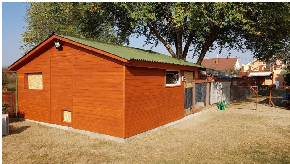
A bokodi nyúlház

Bokodon szintén történtek fejlesztések, minek következményeképp az év második részére már közel 70 db házinyúl elhelyezése vált lehetővé. Az év első felében a már meglévő kifutókat és nyúlólakat kellett karbantartani, felújítani. Az év második felében, pedig felépült egy több mint 20 nm 2 -es szigetelt nyúlház. Ez a bővítés is hozzájárult ahhoz, hogy ebben az évben több házinyúl minőségi ellátását biztosítsuk.