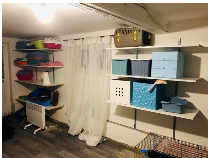
A 17. kerületi polcrendszer