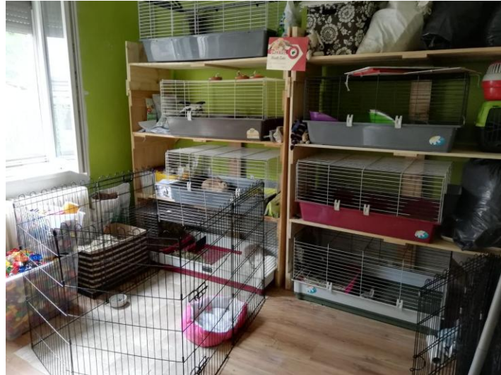
A csepei polcrendszer