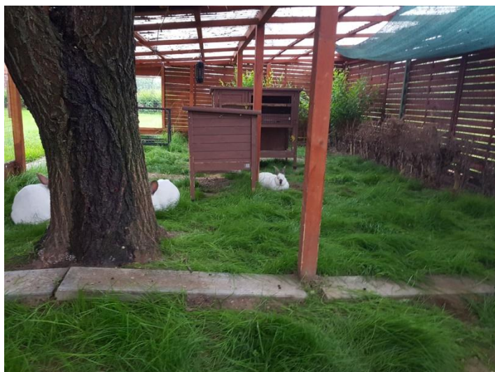
A bokodi nyúl kifutó