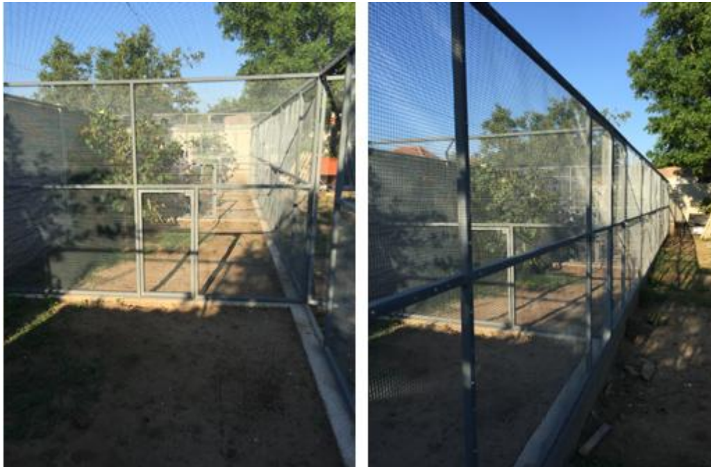
A 17. kerületi kifutórendszer