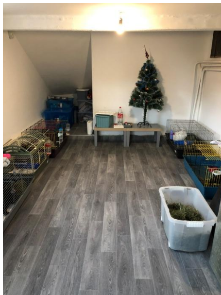
A 17. kerületi nyuszi-tároló